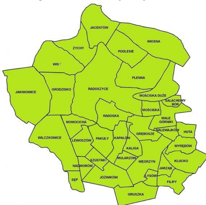
Mapa 1. Gmina Radoszyce w podziale na sołectwa.